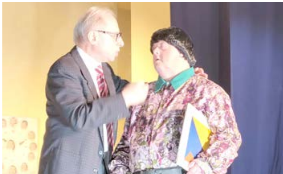
Finalizó la exitosa temporada 2022 del teatro de Caritas (Foto De Sogós).

audiencia, con las diferentes adaptaciones que sufrió, y que la llevaron del año 1909 a los años sesenta y setenta de la década de 1970, donde se estrenó a media-