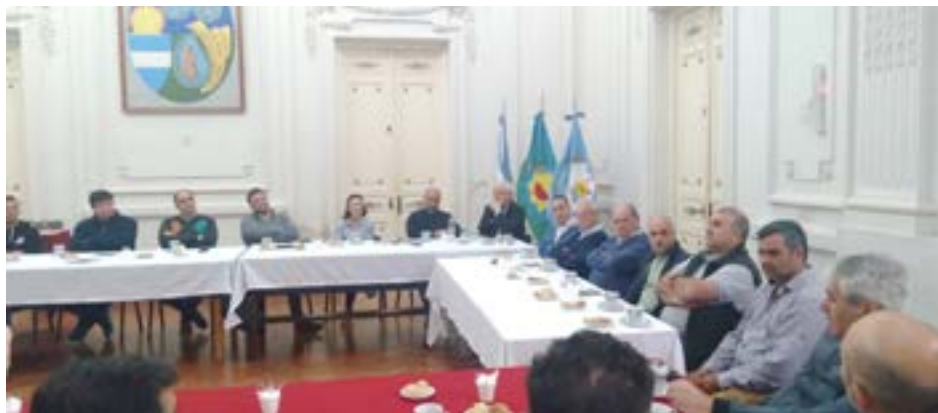
Empresarios que participaron y brindaron su experiencia de trabajo en nuestra ciudad.