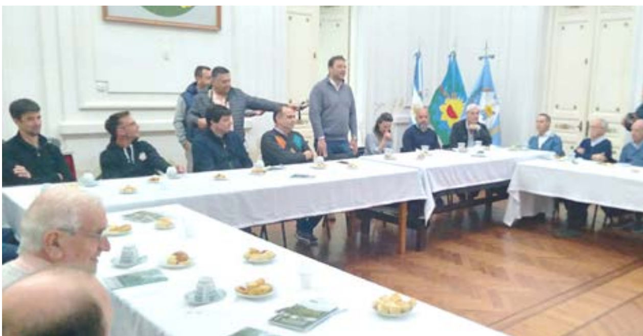
Con un desayuno desarrollado en el Salón Blanco municipal se homenajeó a las industrias nuevejulienses.