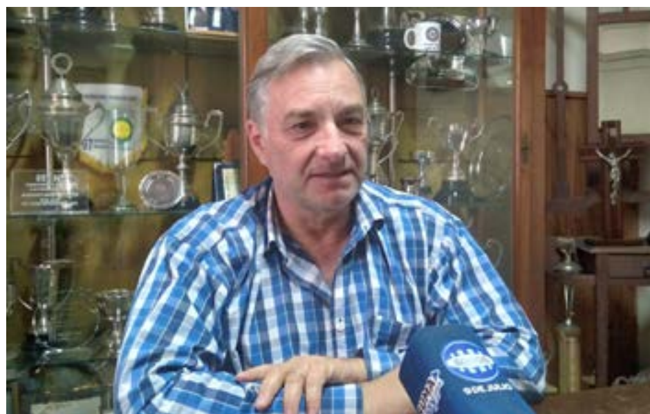
El presidente de la Sociedad Rural 9 de Julio en diálogo con la prensa local (Foto De Sogos).

"La realidad es que más que un beneficio para los productores, es una urgencia para el gobierno, ya que necesita los fondos, y acude a este parche para ver si los consigue. Al productor que sembró y cosechó soja, sí lo beneficia; pero