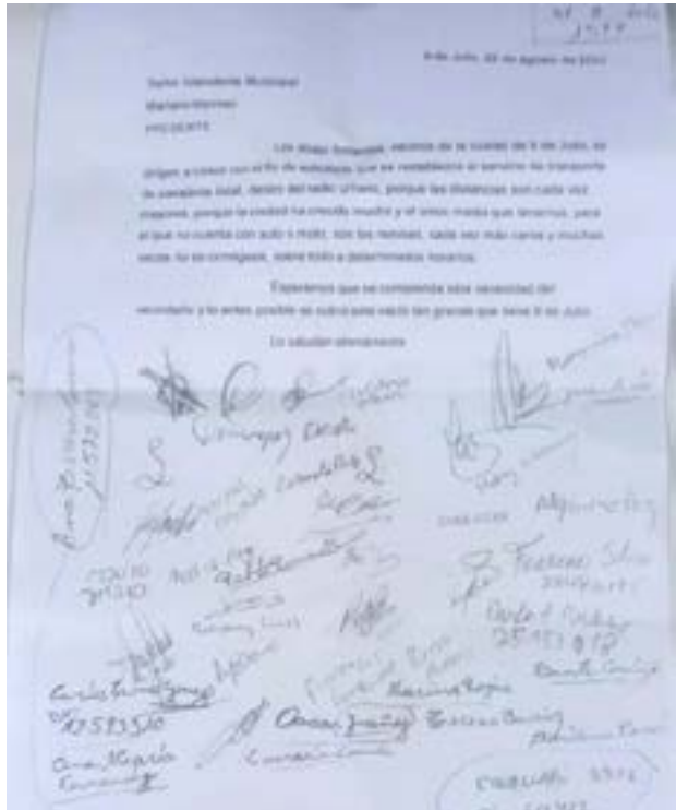
ble se cubra este vacío tan gran que tiene 9 de Julio".