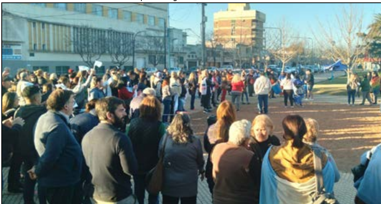
Vecinos que se concentraron en Plaza Belgrano en apoyo a la vicepresidenta y en favor del sistema democrático.

no con la que participaron diferentes agrupaciones políticas oficialistas y vecinos en general. Todos se manifestaron pacíficamente empuñando banderas argentinas.