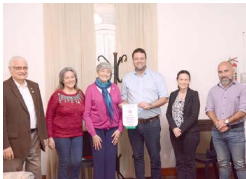
El jefe comunal y funcionarios compartieron una amena charla con las autoridades rotarias en donde abordaron proyectos comunes y acordaron una agenda de trabajo.