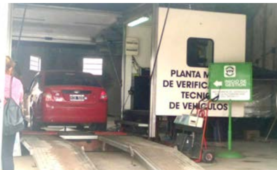
La planta móvil de la VTV que se encuentra en nuestra ciudad continúa atendiendo a todas las personas que sacan sus turnos online.

De acuerdo al protocolo, cada persona debe permanecer en el auto