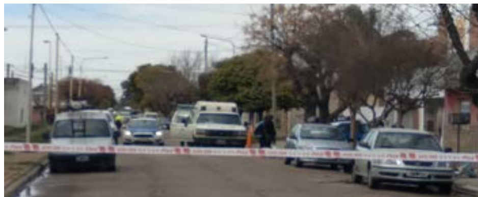
Personal policial, policía científica y ayudantía fiscal trabajaron en el lugar del trágico hecho.