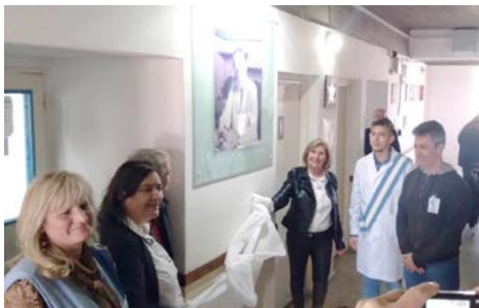
Preciso momento en que se descubre en el pasillo de la escuela un cuadro con la imagen de Favalaro.

Posteriormente, el padre Mamerto Menapace efectuó la bendición de las instalaciones mientras que aseguró que “fue la casualidad la que me permitió conocer al Dr. Favalaro, en oportunidad de la entrega de premios a argentinos que habían hecho patria, entre ellos