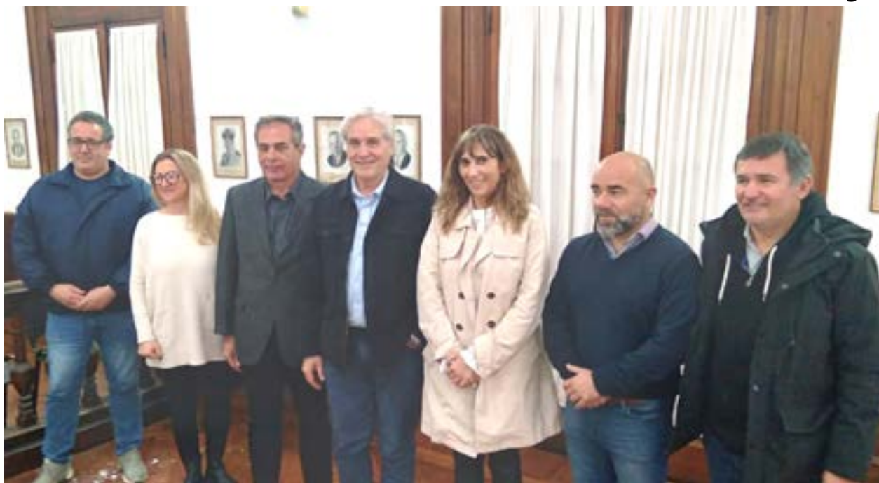
Autoridades de la Cámara, del CAME, del nucleamiento y municipales en rueda de prensa.

EL NUCLEAMIENTO ANTE LA CRISIS DE LA ECONOMIA