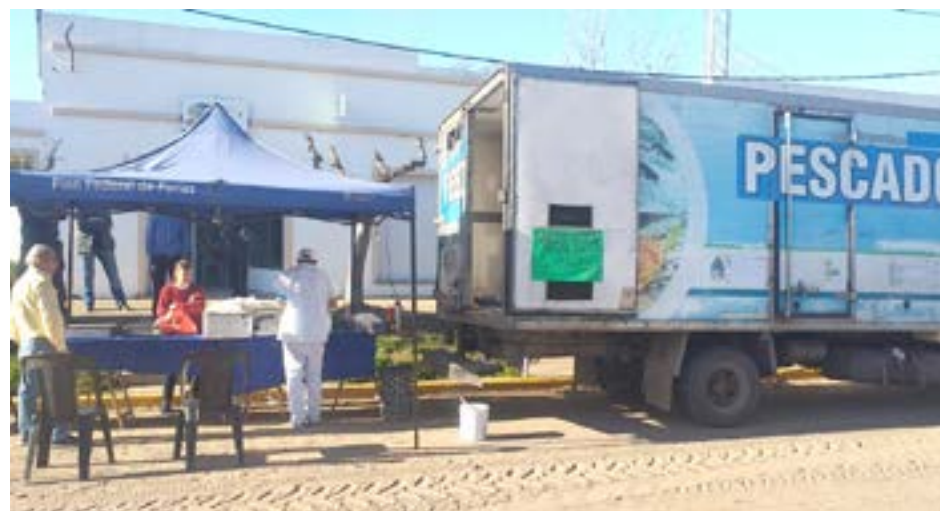
Se realizó con éxito la recorrida en las diez localidades de nuestro distrito.