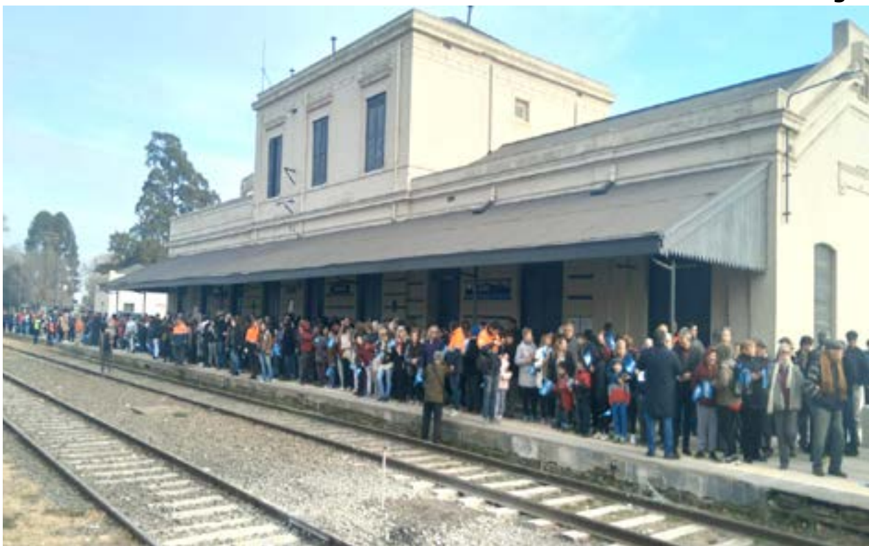
Vecinos se sumaron al acto simbólico de la llegada del tren a nuestra ciudad y ciudades vecinas.