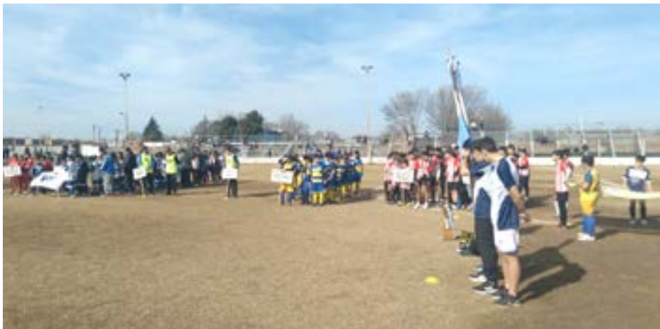
Con equipos juveniles de 9 de Julio y de varias ciudades de la zona comenzó la Copa Sanmartiniana.