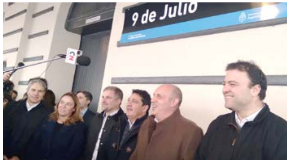
Funcionarios nacionales, provinciales y municipales presidieron el acto el día de ayer.

Guerrera subrayó también que “esta formación simboliza la vuelta del tren de pasajeros a la Argentina como una política de Estado, con una decisión política muy fuerte del Presidente de la Nación, acompañada por Sergio Massa desde la Cámara de Diputados, entregándonos las herramientas económicas para recuperar estos más de 160 kilómetros después de más