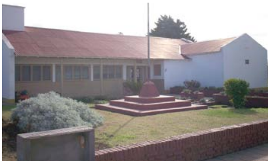
Frente del hospital "Enriqueta Dudignac", uno de los próximos a refaccionar.