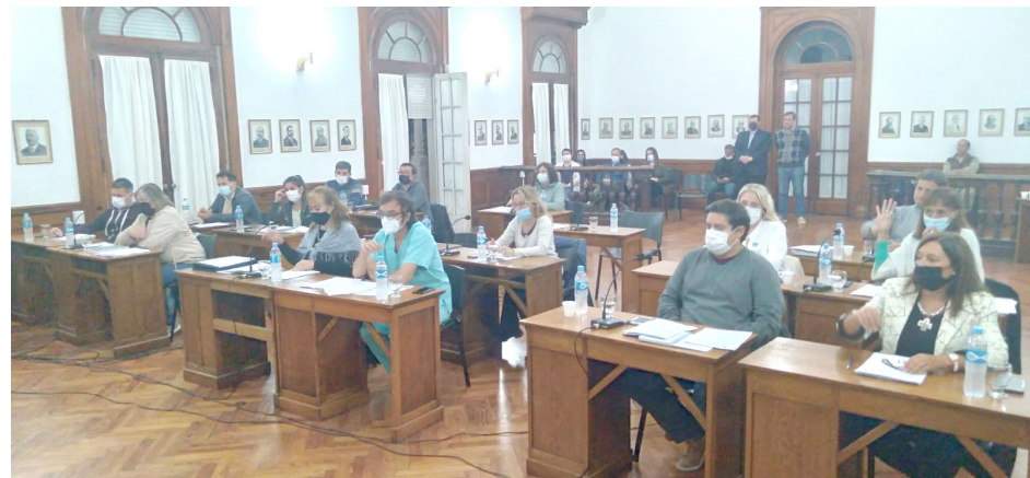
Bloque de Concejales que participaron de la sesión del HCD.