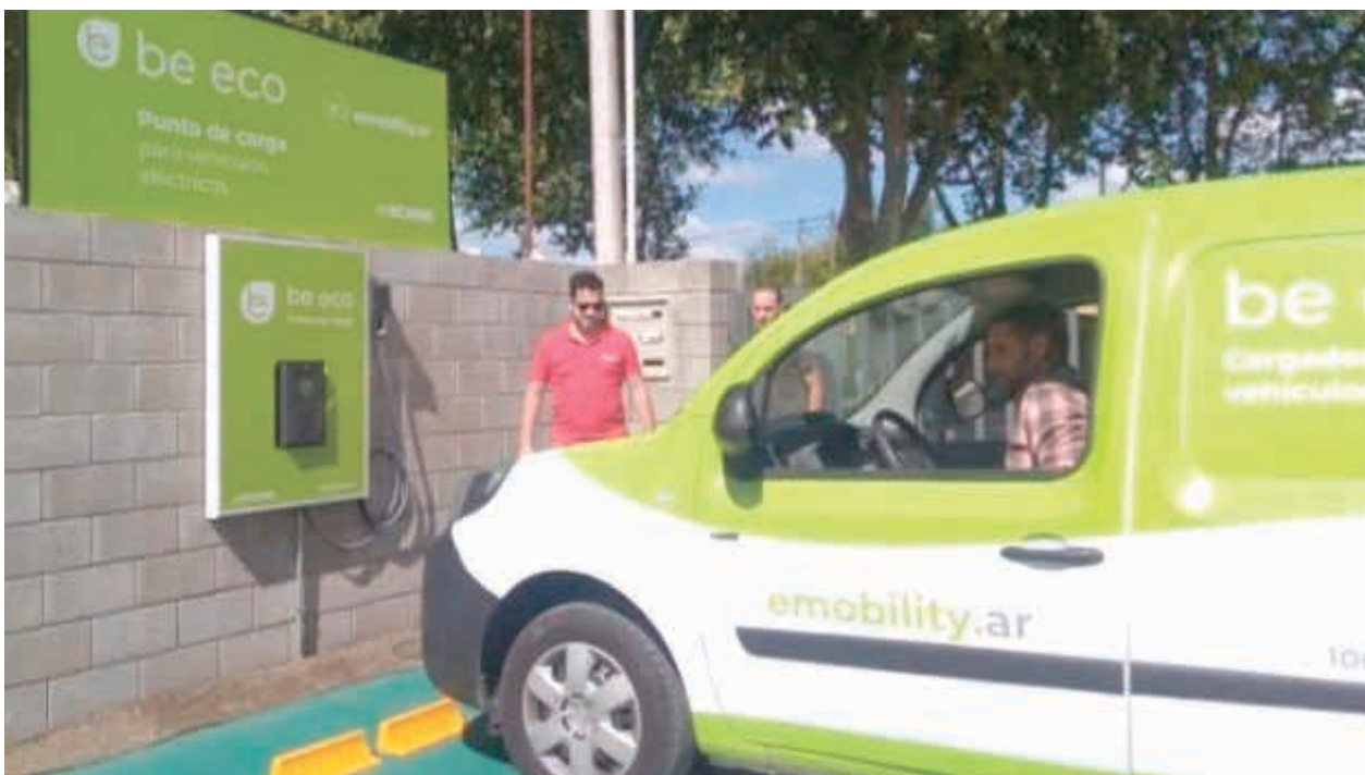
La firma local de la Flia. Amerio inaugura el primer punto de carga en nuestra ciudad.