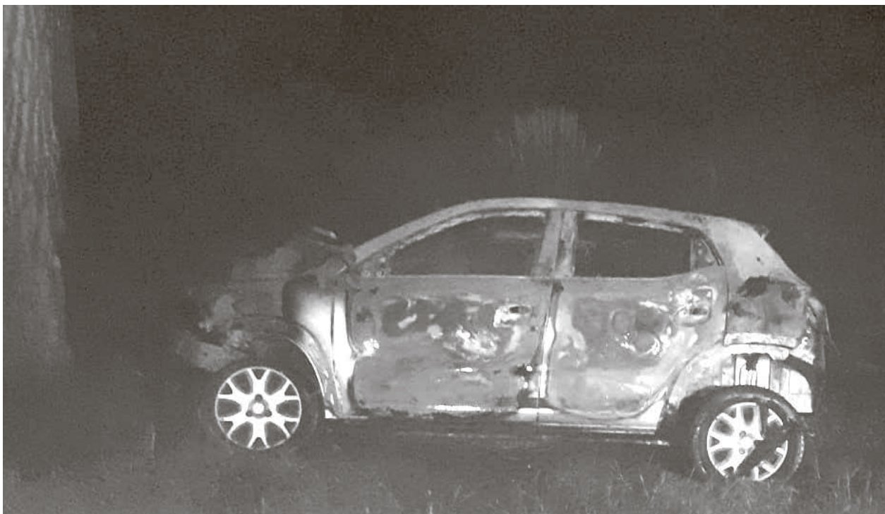
El vehículo se vio consumido por las llamas.