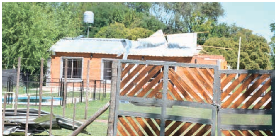
les y las ramas caídas en diferentes sectores y en el Parque Colonia San Rafael.

En esta comunidad, voluntarios de la Sociedad de Fomento y el Club 18 de Octubre, retiraron los árboles