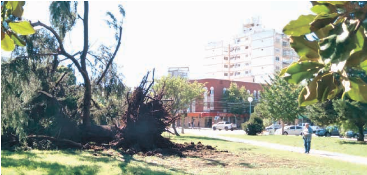
Imponente imagen de un pino derribado por el fuerte viento en pleno centro de la ciudad.