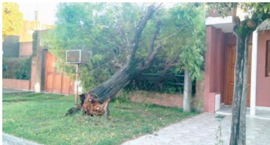
Varios árboles, postes de luz y teléfono, chapas y luminarias fueron alcanzadas por las ráfagas de viento.