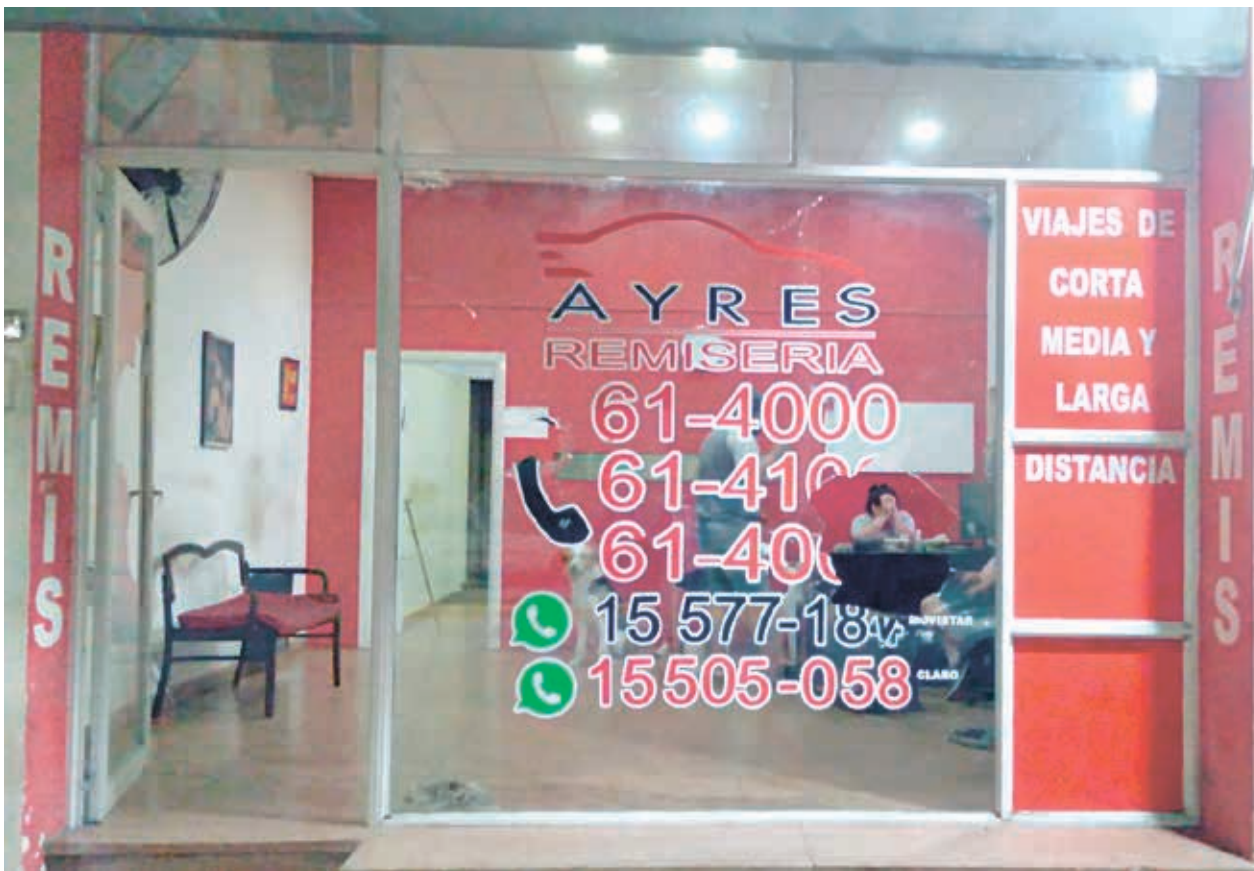
La imagen muestra el estado en que quedó la vidriera de la remisera Ayres después del insólito incidente.

Seis jóvenes agredieron a la coordinadora que debió ser atendida por Clysa Jovenes ocasionaron daños en la remisera Ayres y agredieron a su coordinadora el domingo a la madrugada. Inf. en Pág. 2