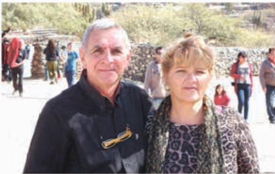
Conduce: Héctor Rodolfo Tinetti Cámaras: Micaela María Petetta