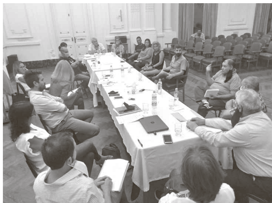
Un pasaje de la cuarta reunión que realiza el municipio con los sindicatos que representan a los trabajadores municipales junto a funcionarios y concejales.