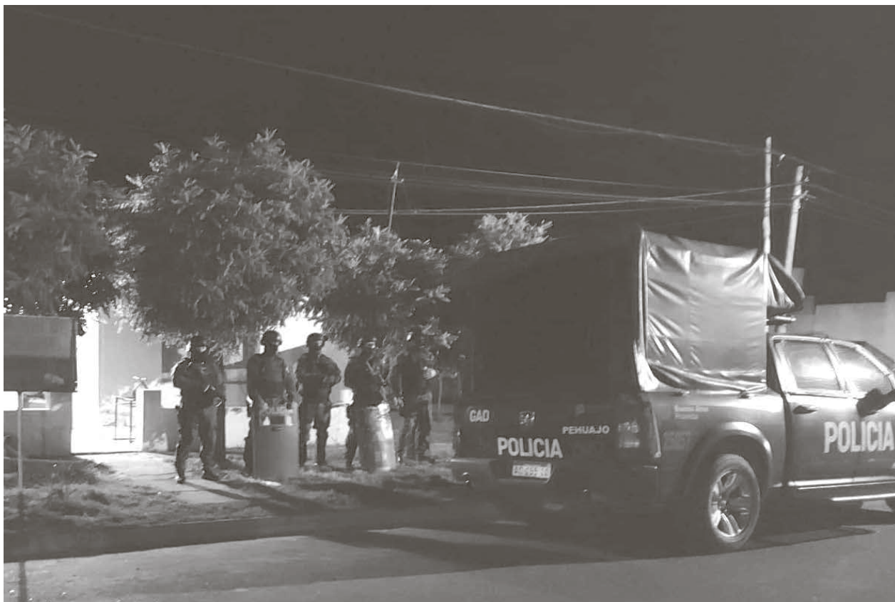
Personal policial trabajó con orden de allanamiento en uno de los domicilios