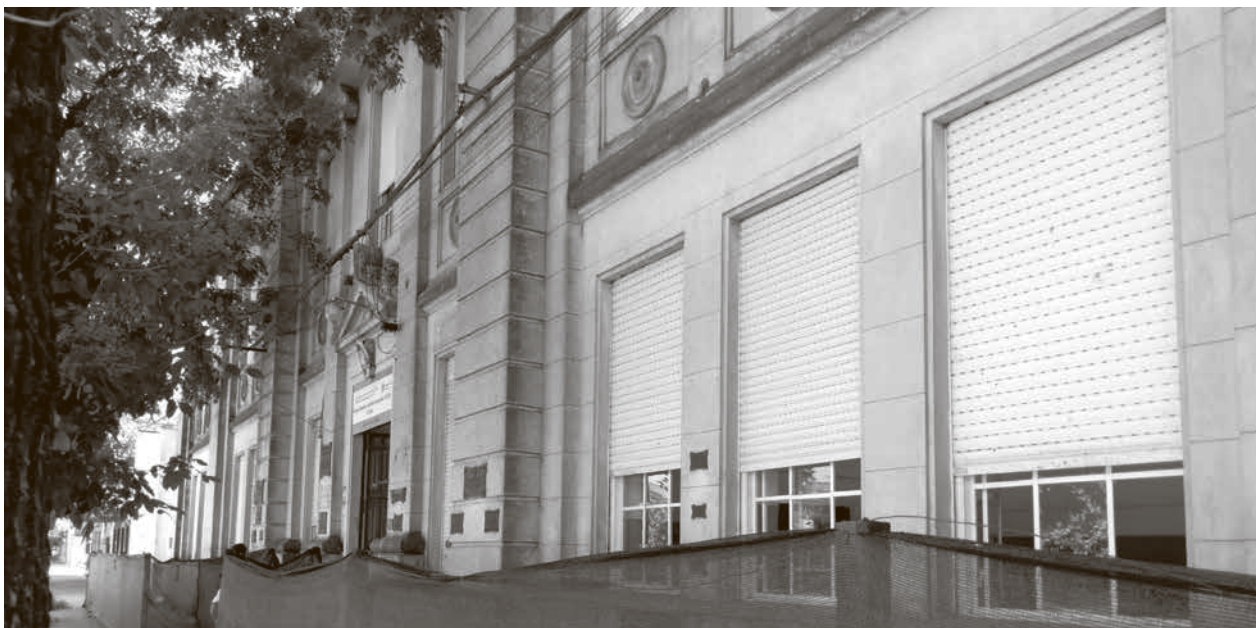
La Escuela N° 1 se encuentra con vallas de contención a modo de protección por trabajos en el frente del edificio.