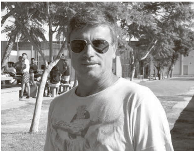
Javier Braña será el nuevo DT de Hókey