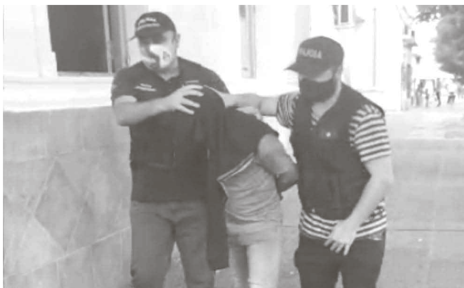
Personal policial traslada al detenido a la Comisaría.

A raíz de actuaciones policiales, caratula- ción de la Unidad Funcional de Instrucción