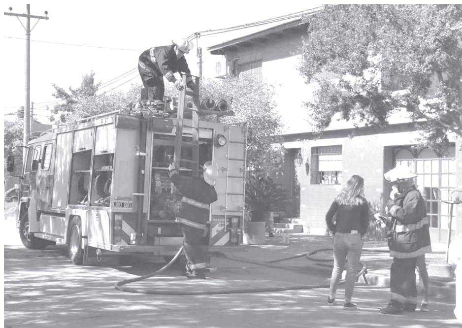
Personal de Bomberos Voluntarios y de policía, trabajaron en el siniestro.

Se contó con el apoyo de Policía Comunal a quien Personal de Bomberos hizo entrega de bienes de valor,