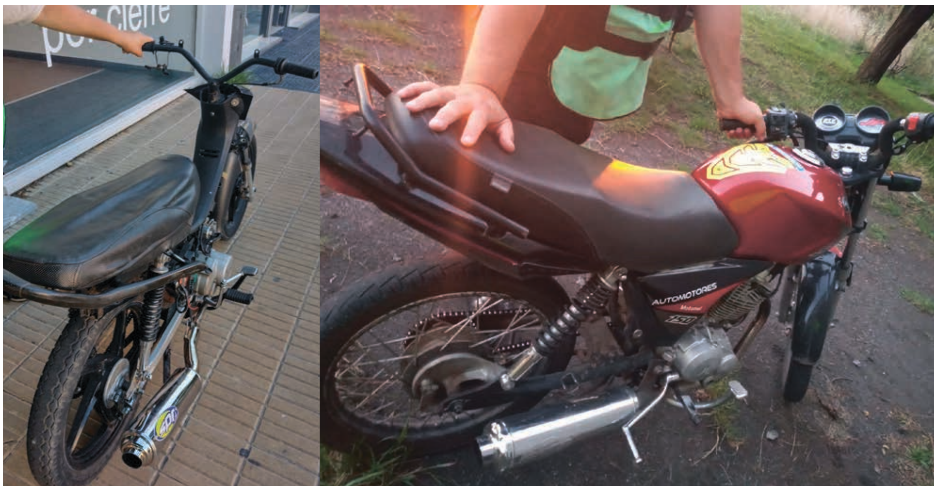
Dos de los motovehículos secuestrados durante los operativos realizados durante el fin de semana.

La Subsecretaría de Seguridad y Tránsito, dependiente de la Secretaría de Gobierno municipal llevó a cabo durante el fin de semana intensos operativos en distintos puntos de la ciudad, algunos de ellos de los denominados fijos y otros "sorpresa", contándose con el apoyo del Centro