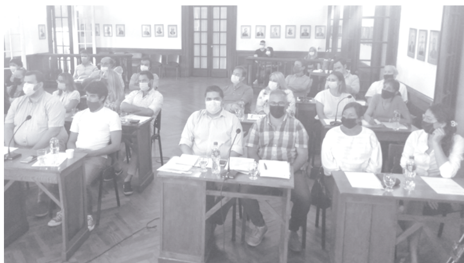
Dos aspectos de la Asamblea de Concejales y Mayores Contribuyentes que el día jueves aprobaron las ordenanzas Fiscal e Impositiva.

Tal como estaba pautado, se realizó en la noche del pasado jueves, la Asamblea de Mayores Contribuyentes en la cual se aprobaron las ordenanzas Fiscal e Impositivo para el presente año.