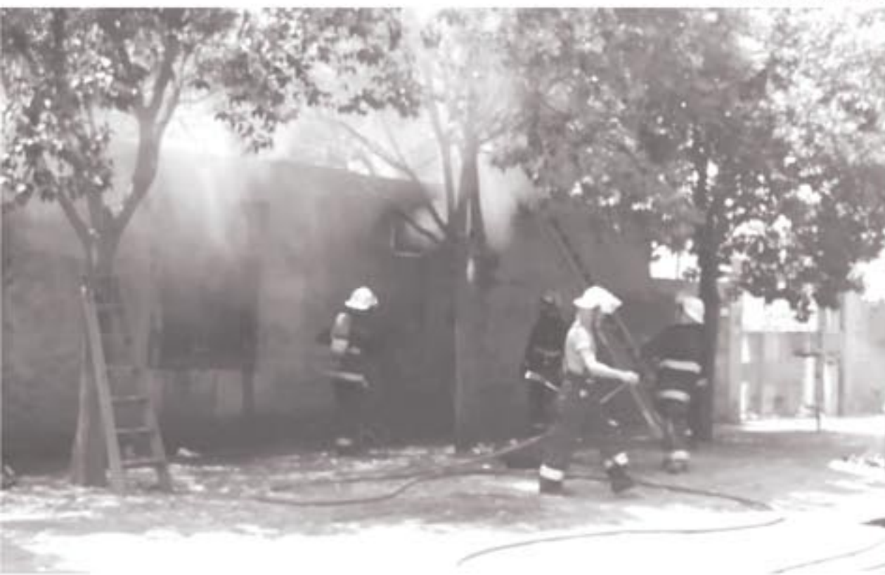
La ardua tarea de los Bomberos Voluntarios no pudo impedir el incendio total de una vivienda