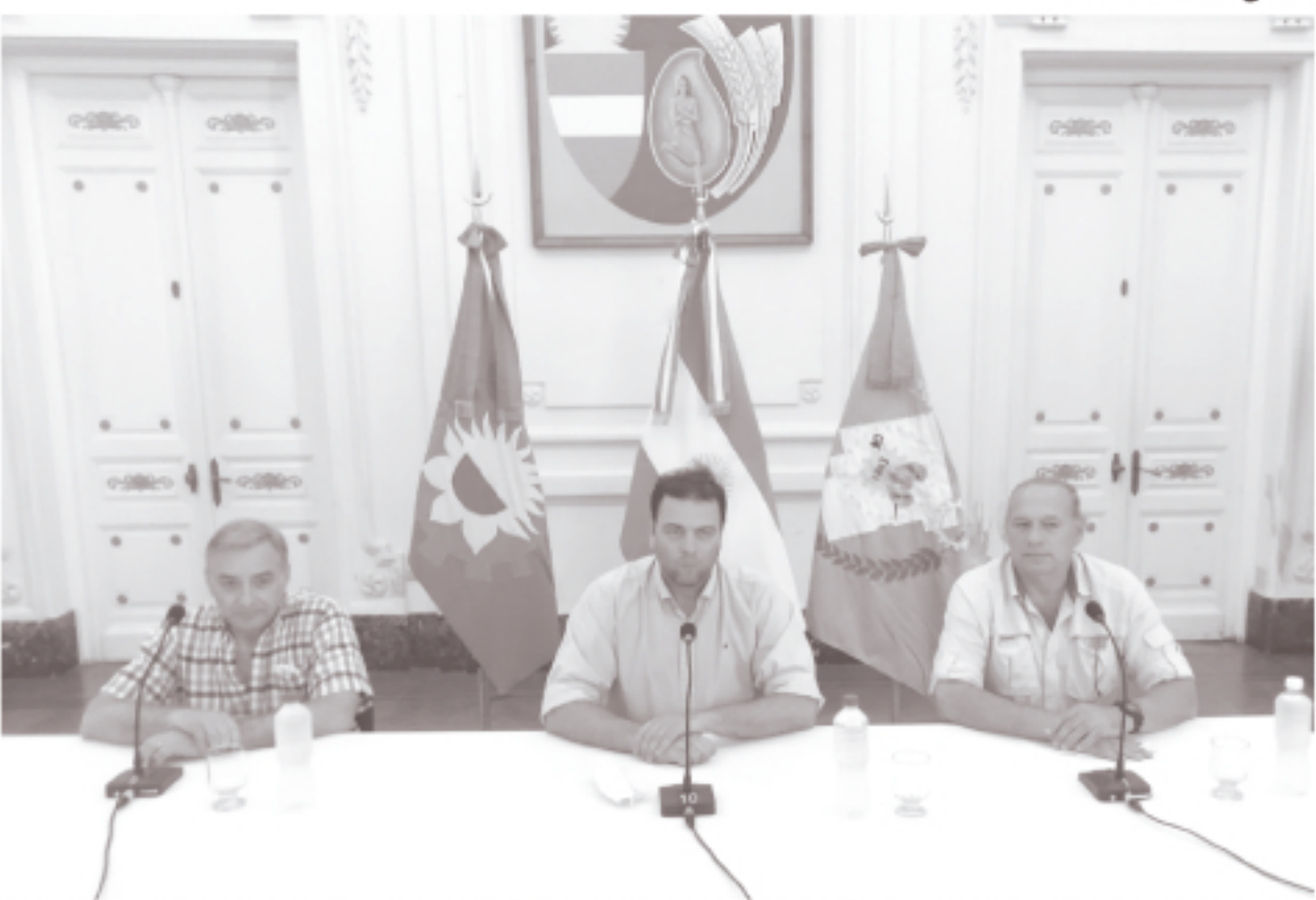
El Intendente Municipal y el presidente de Sociedad Rural agradecieron a Berni por la ayuda de la provincia para la seguridad rural.