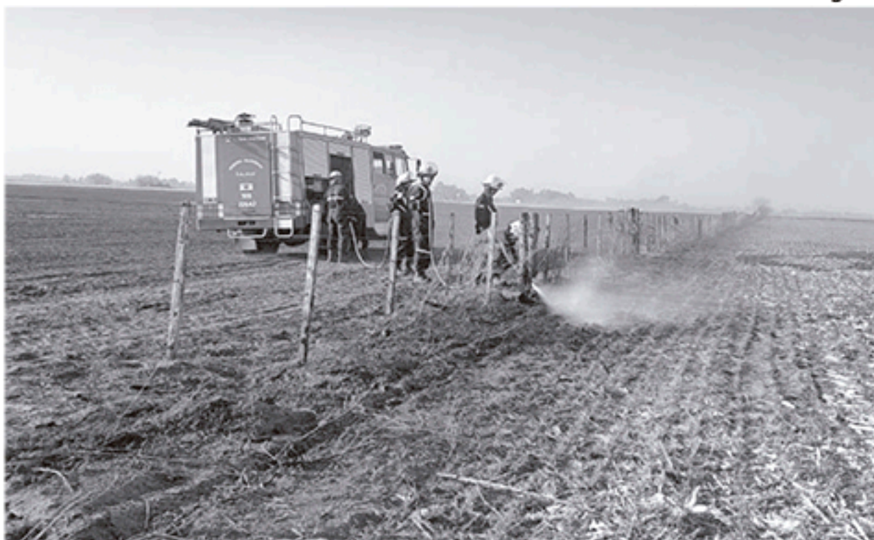
Bomberos Voluntarios sofocaron el fuego en uno de los campos afectados, a unos 500 metros de Ruta 5.

ECOS DEL CONSEJO ABIERTO DE CARBAP EN OLAVARRÍA