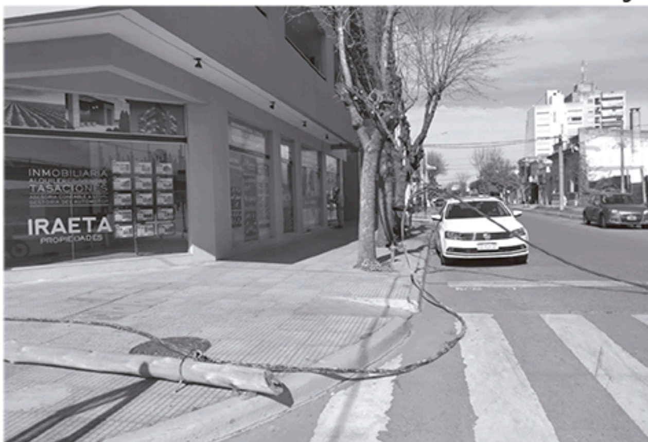
La imagen muestra parte del cableado arrancado por la caída de un poste en el insólito hecho ocurrido en San Martín y Robbio.