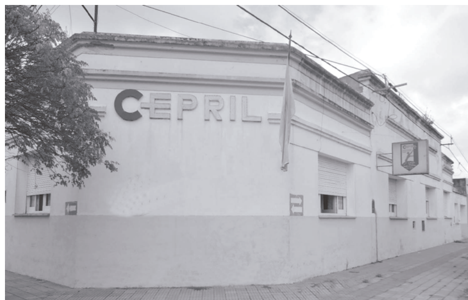
CEPRIL reanuda a partir de mañana jueves su atención en administración y consultorios.

rios funcionará de 9,30 a 12,00 hs., todos los días martes y jueves, continuando con este cronograma lo que resta del mes de agosto, para paulatinamente ir incorporando nuevas atenciones, de acuerdo a la situación epidemiológica de nuestro distrito.