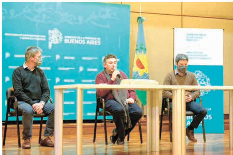
La Subsecretaría de Recursos Hídricos de la Provincia de Buenos Aires a través de la Dirección Provincial de Agua y Cloaca (DIPAC) licitó la obra "Cisterna de

Se trata de una Cisterna de 2000 m3 de reserva que beneficia a un total de 36.494 habitantes.