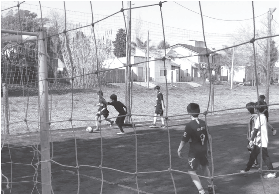
El fútbol de chicos, una de las actividades permitidas.

El Club Ciudad de 9 de Julio, poco a poco, vuelve a sus actividades deportivas presenciales, para lo que ha abierto la inscripción de interesados en sumarse a distintas disciplinas, tras un año completo de restricciones.