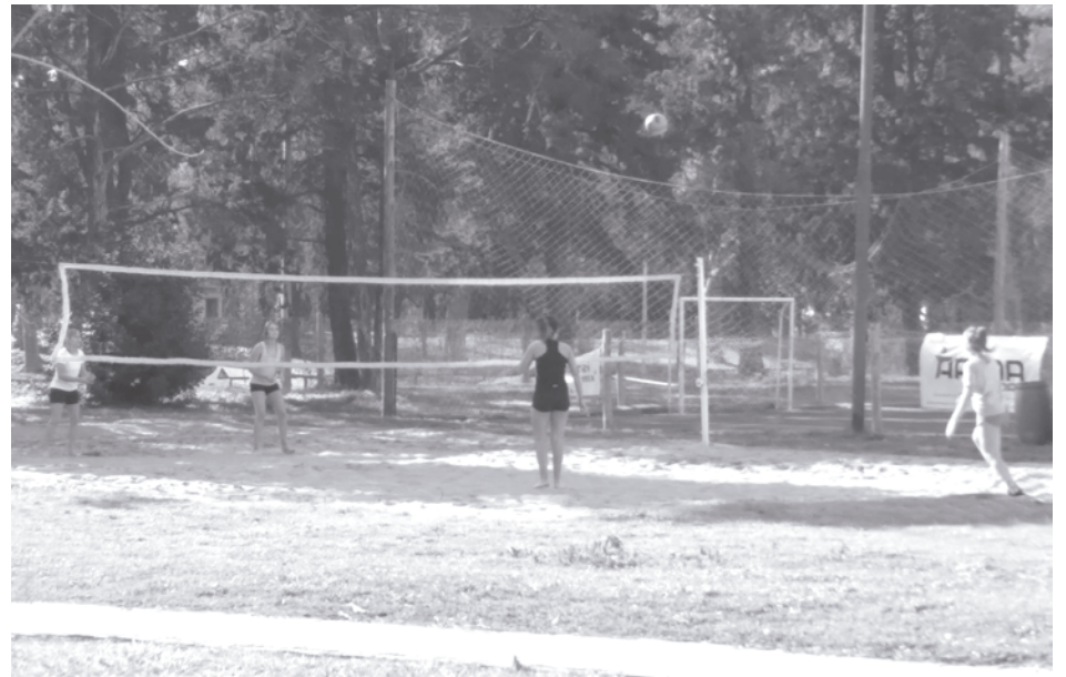
El voley playa y el newcom voley adaptado en categorías 50, 60 y 70, hombre y mujeres.