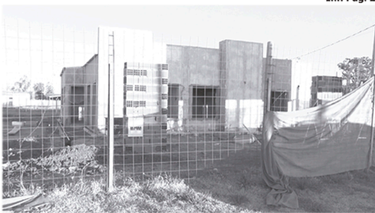
La imagen muestra una de las viviendas que se encuentra en ejecución.