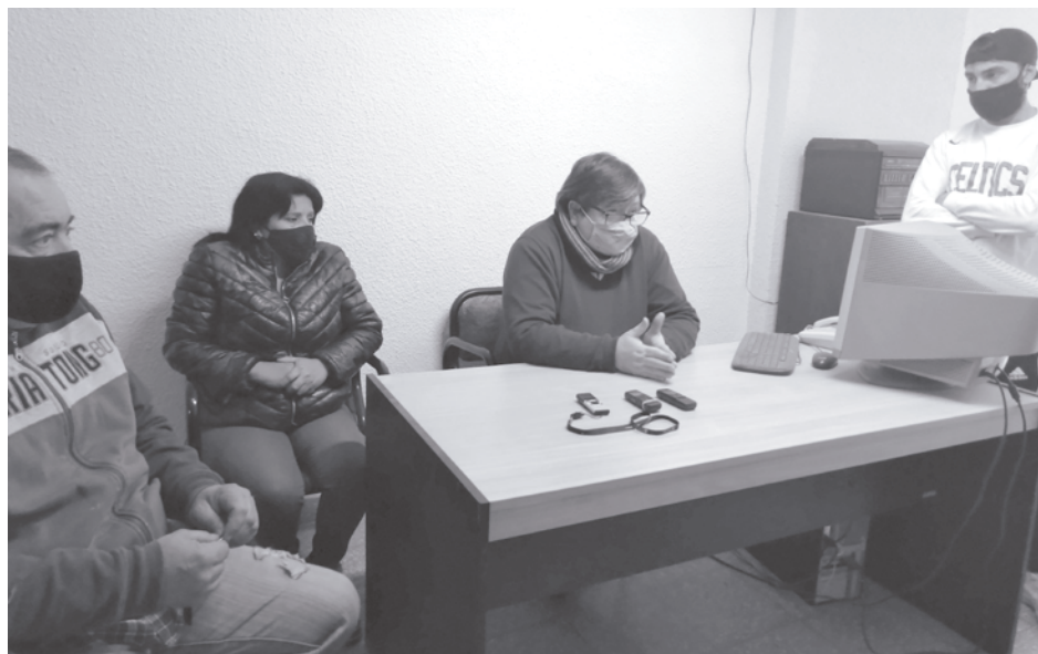
Los vecinos que fueron estafados hace un tiempo piden ayuda y algún tipo de solución a su problema.

"Más allá de las investigaciones internas, nuestro deseo es conocer la marcha de las investigaciones internas que desde el municipio prometió realizar el secretario de Gobierno, lo que nos permitiría establecer quiénes fueron los responsables en este ámbito, ya que si centralizamos las responsabilidades en la persona que comercializaba los terrenos,