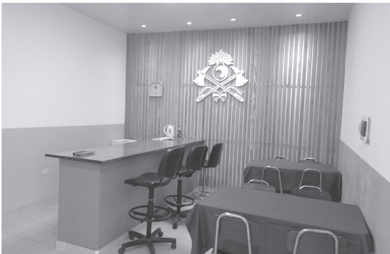
El sector de casino fue recientemente refaccionado para el uso de los bomberos.