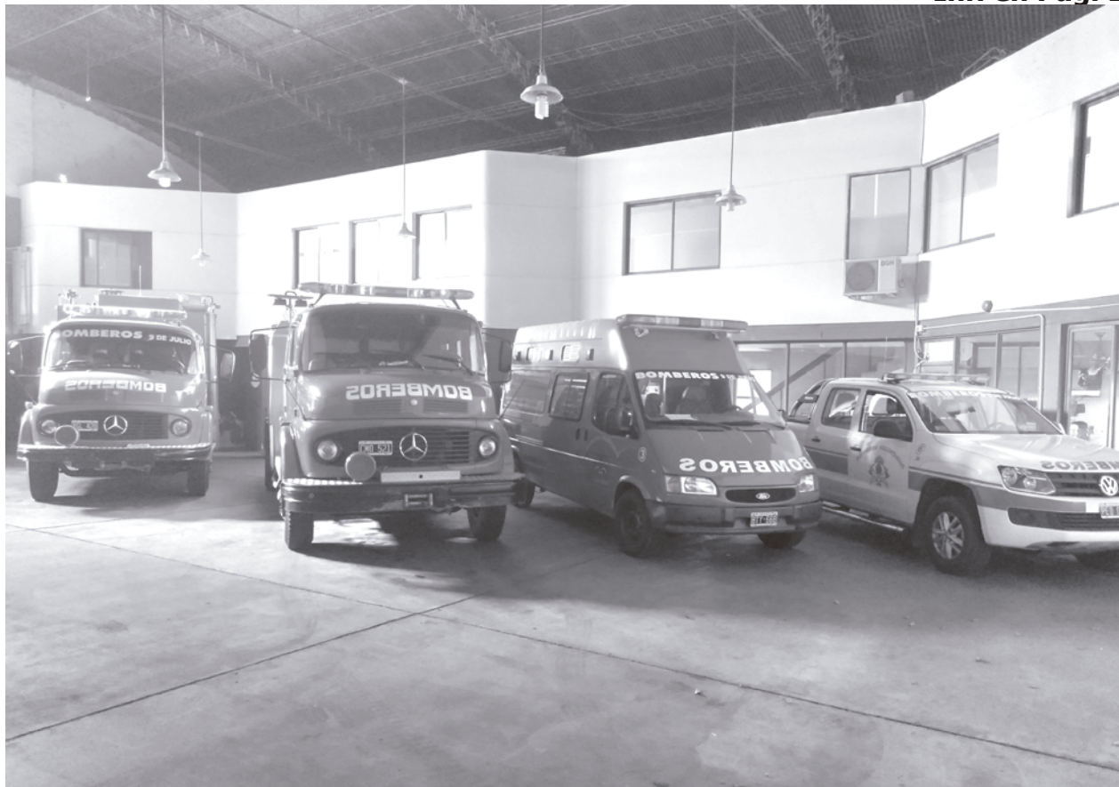
Unidades móviles pertenecientes a la Asociación Bomberos Voluntarios fundada el 10 de julio de 1946.