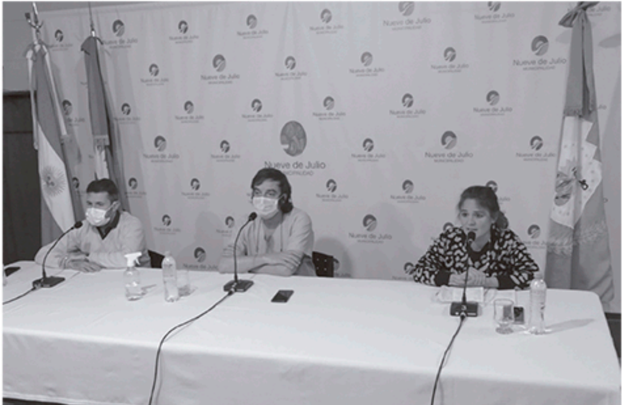
Mucha preocupación en los médicos que realizan la conferencia de prensa semanal por los 521 casos activos actuales y las 191 personas fallecidas.

SE APLICARÁN EN AMBAS POSTAS Arribaron a 9 de Julio 4.000 nuevas dosis de vacunas AstraZéneca Inf. en Pág. 3.