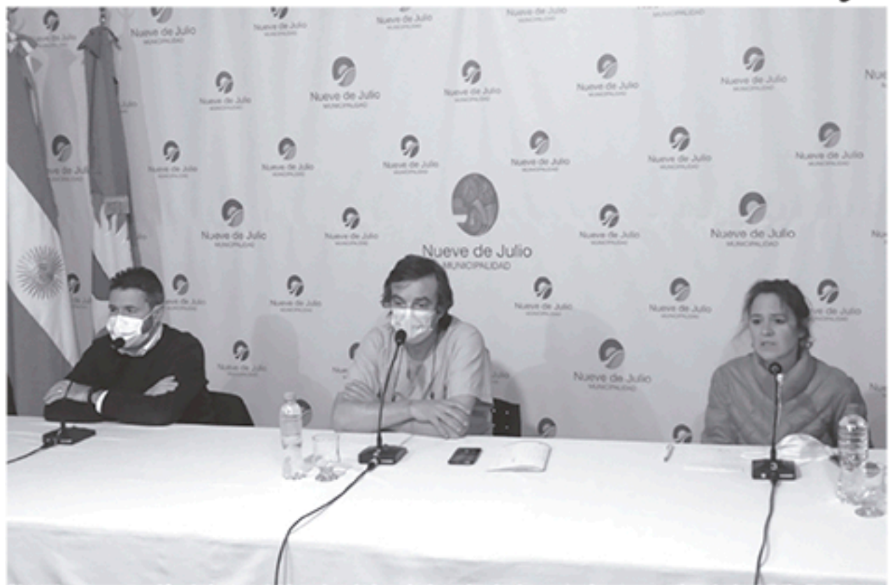
Sigue la preocupación de los profesionales de la salud por la ola de contagios en nuestra ciudad.