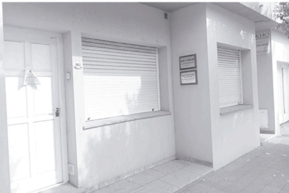
Sede del Colegio de Odontólogos, sito en calle Gutiérrez al 900.