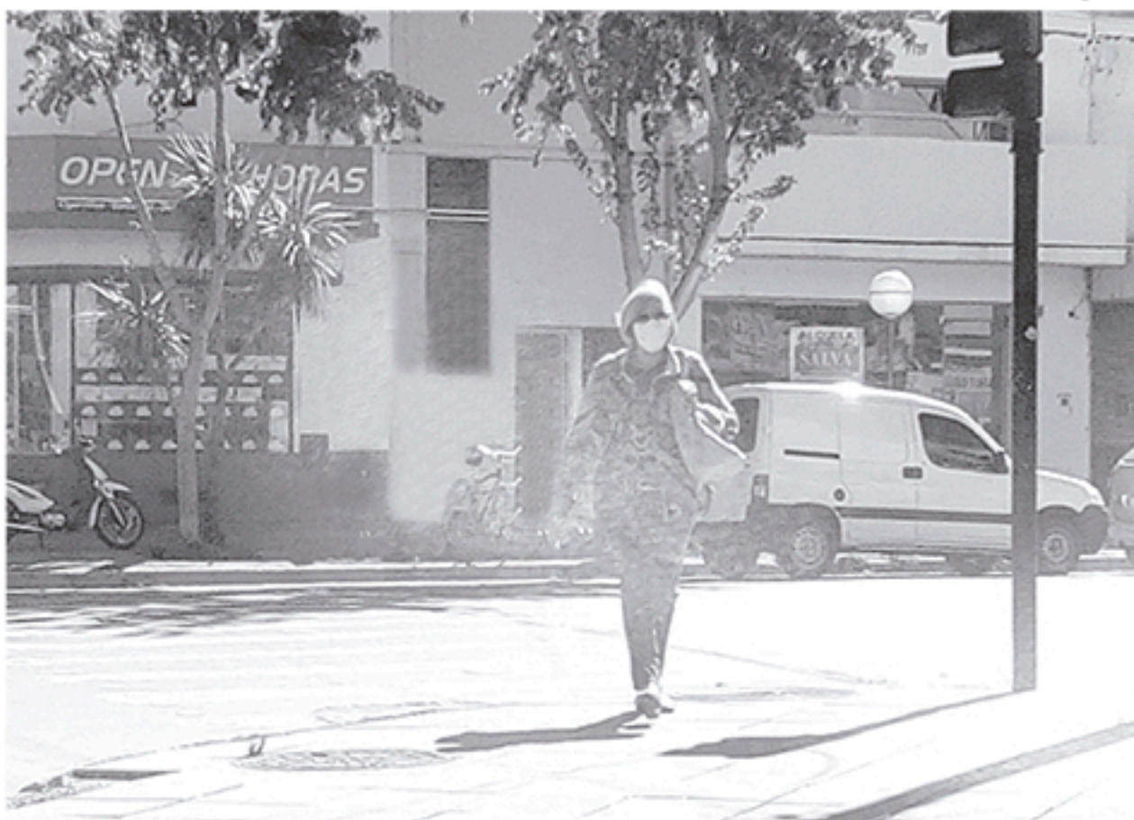
Nueve de Julio también adhirió al decreto provincial del uso obligatorio de tapabocas.