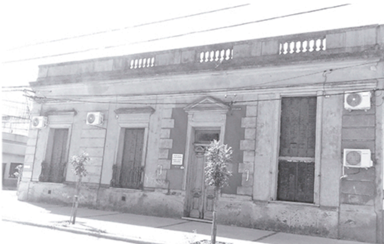
Desde Jefatura Distrital local se informó de la llegada del importante material educativo.