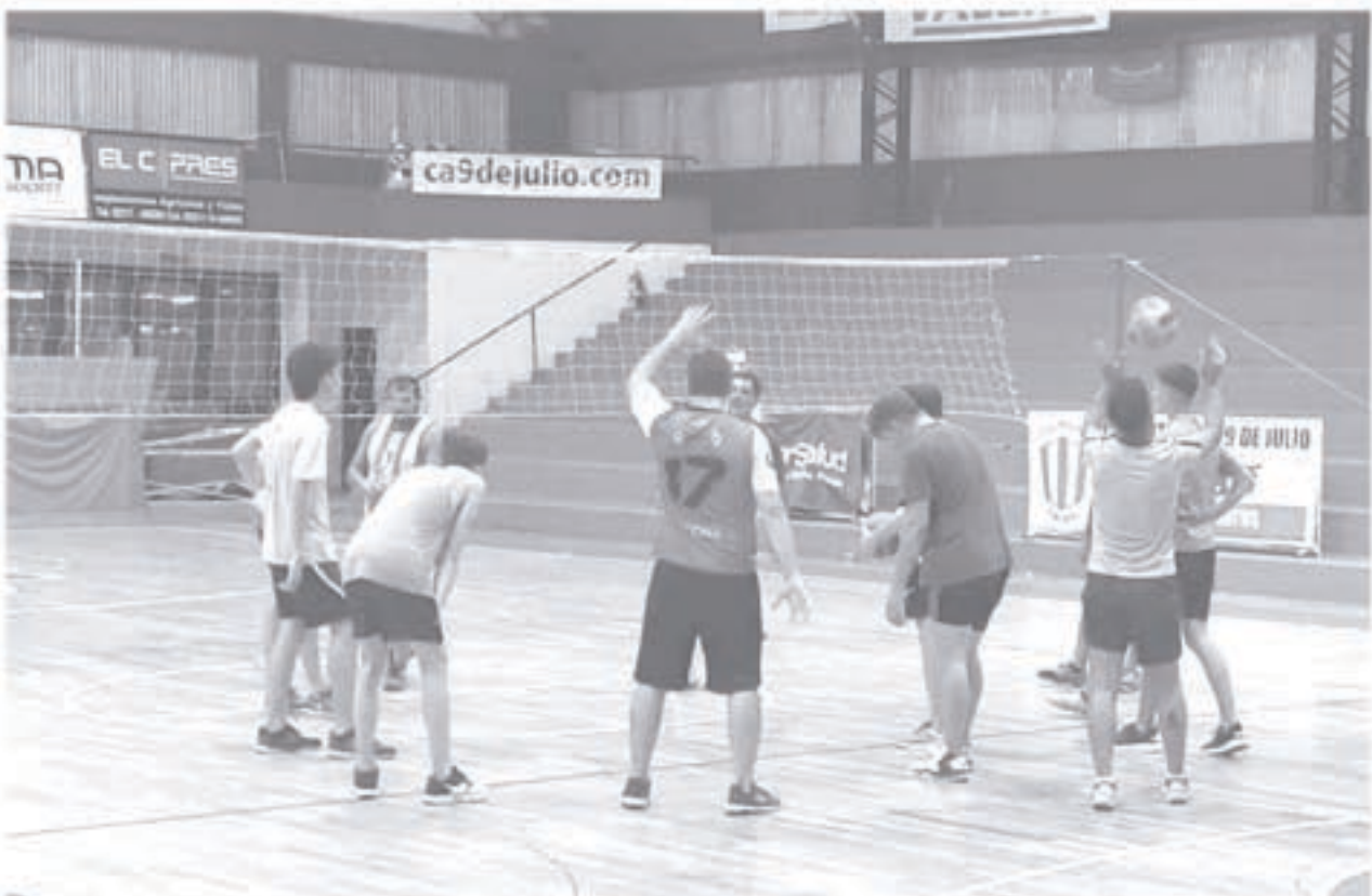
Arrancó la actividad del voley masculino en el Club Atlético 9 de Julio.