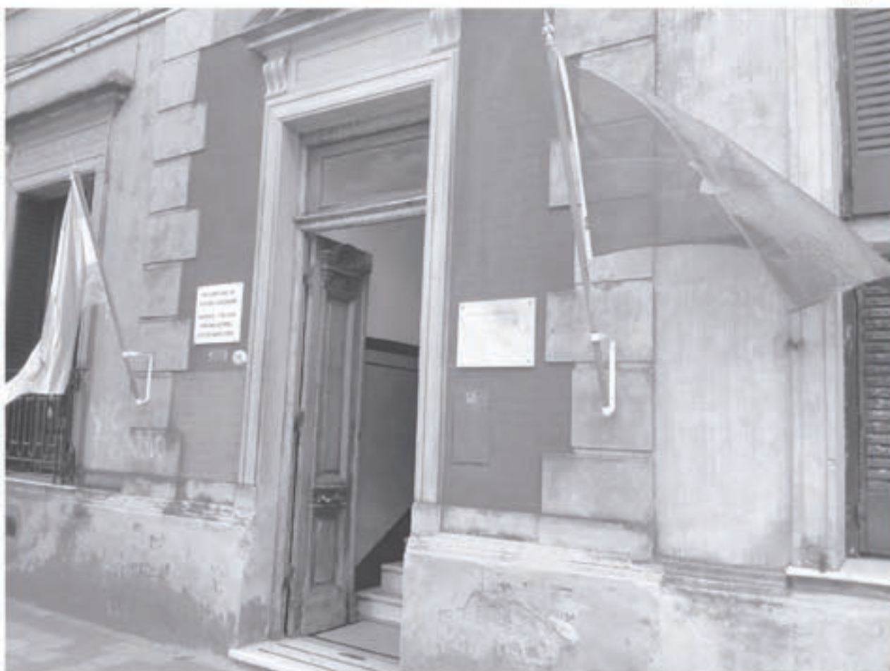
Edificio donde funcionaba la Jefatura Regional que a partir de hoy vuelve nuevamente a Pehuajó.