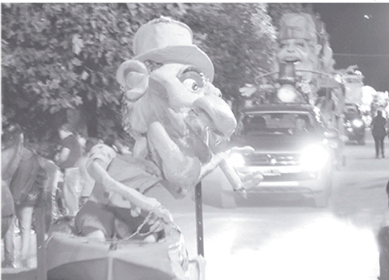
Se vienen los tradicionales corsos en French con mascaritas, caretones, comparsas y murgas.

EN LAS RESTANTES ENTIDADES, SERÁ DE 10 A 12 HS.