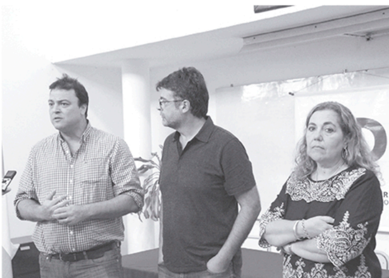
Autoridades municipales y de la UTN, en diálogo con la prensa.

PARALELAMENTE AL DESARROLLO DE LAS ESCUELAS ABIERTAS DE VERANO