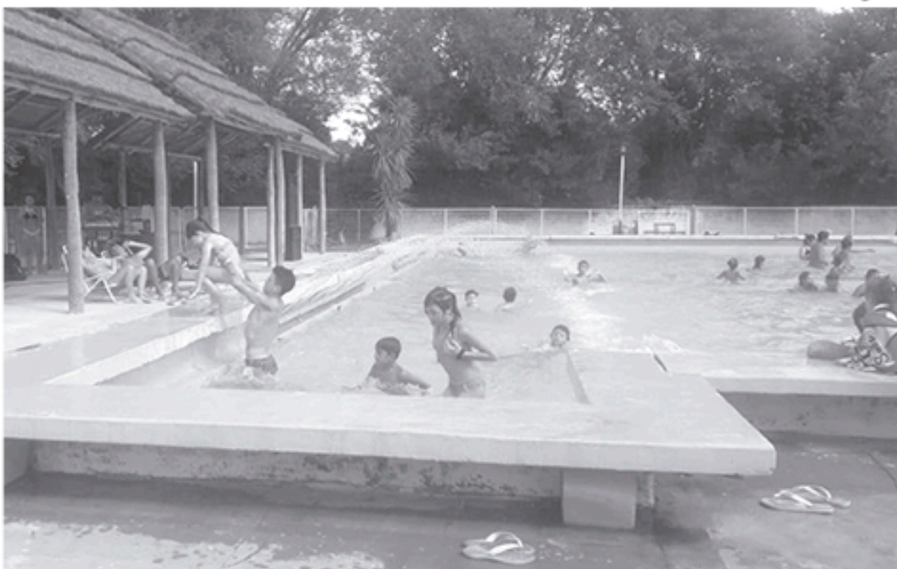
El natatorio a pleno el día sábado, oportunidad en que se celebró el nuevo aniversario del Club Libertad.