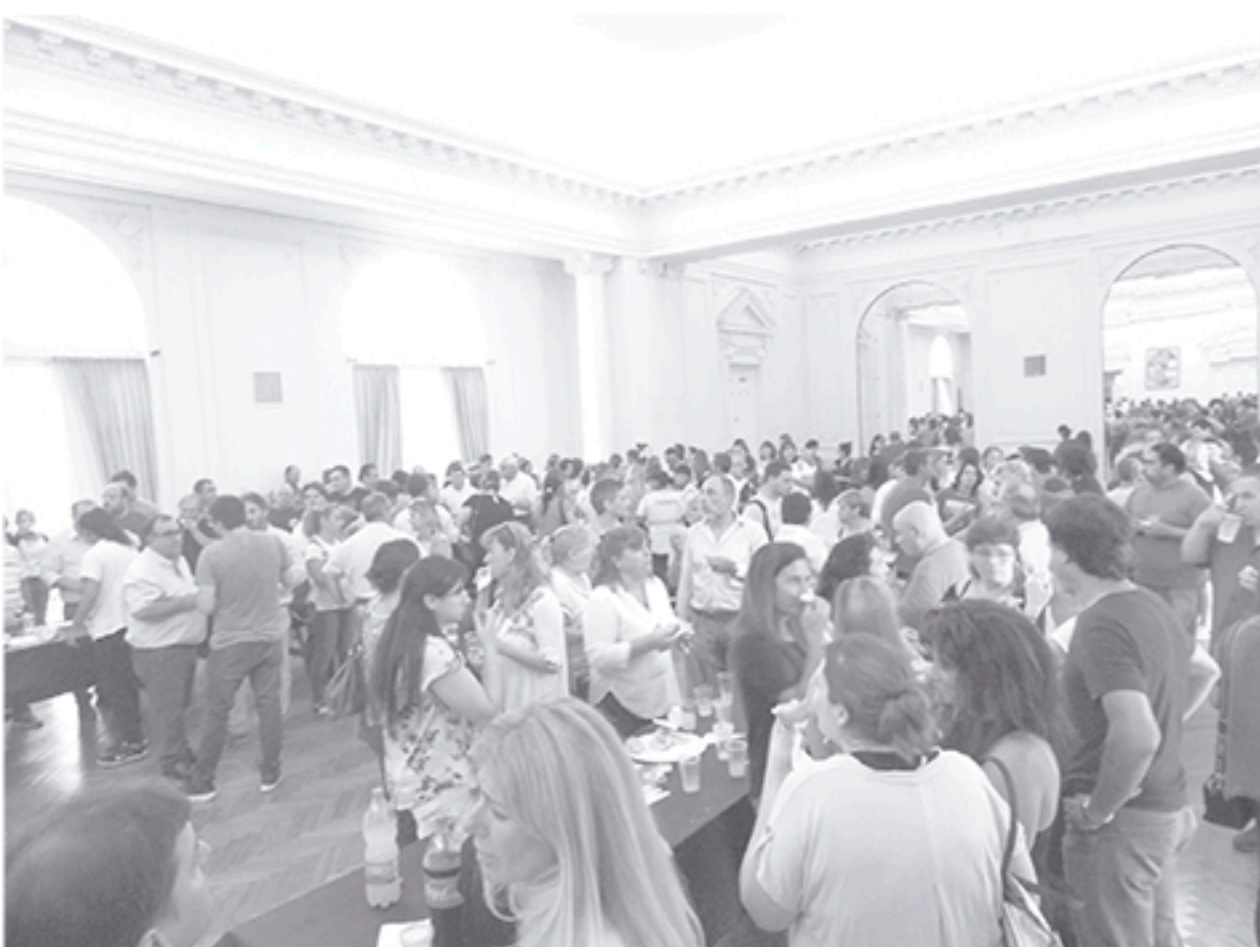
Se realizó ayer el tradicional brindis de Fin de Año en el municipio.

El Intendente Municipal habló con Diario Tiempo luego de encabezar el tradicional brindis de fin de año. Inf. en Pág. 8 y 9