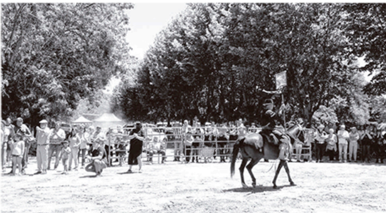
Pasaje del evento cultural realizado el pasado fin de semana en la localidad de Carlos María Naón.