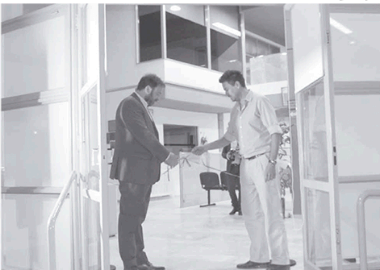
Preciso momento e que se realiza el corte de cinta que daja inauguradas las nuevas dependencias.