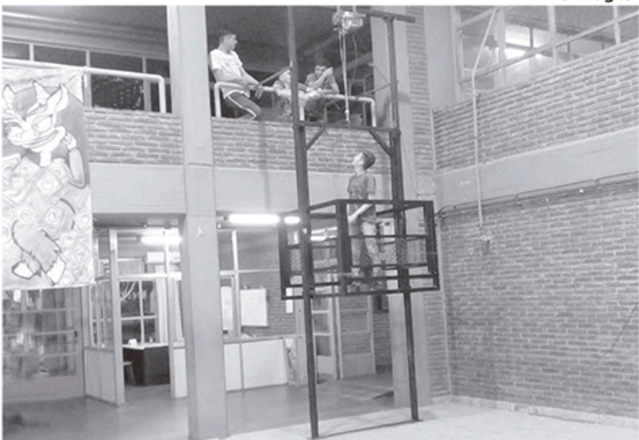
Alumnos del establecimiento instalan un elevador monta cargas que funcionará entre el salón de actos y el 1er. piso, el mismo será parte de la ExpoTécnica 2019.