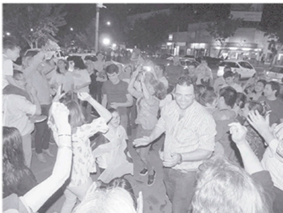
El Intendente Municipal muestra toda su alegría junto a su familia e integrantes de la lista después de conocerse el resultado de la elección.