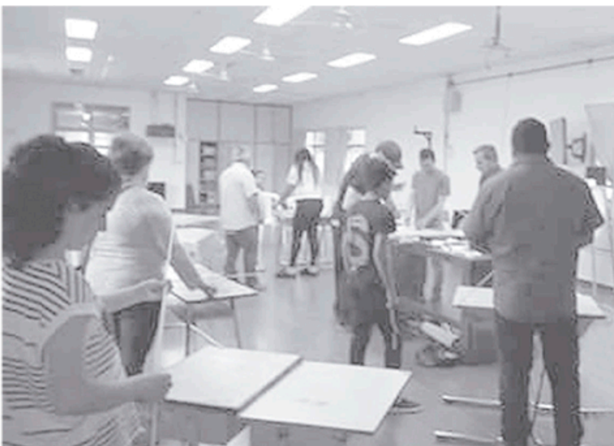
Imagen del taller realizado en la jornada del miércoles, en las instalaciones de la Escuela Técnica Nro. 2.