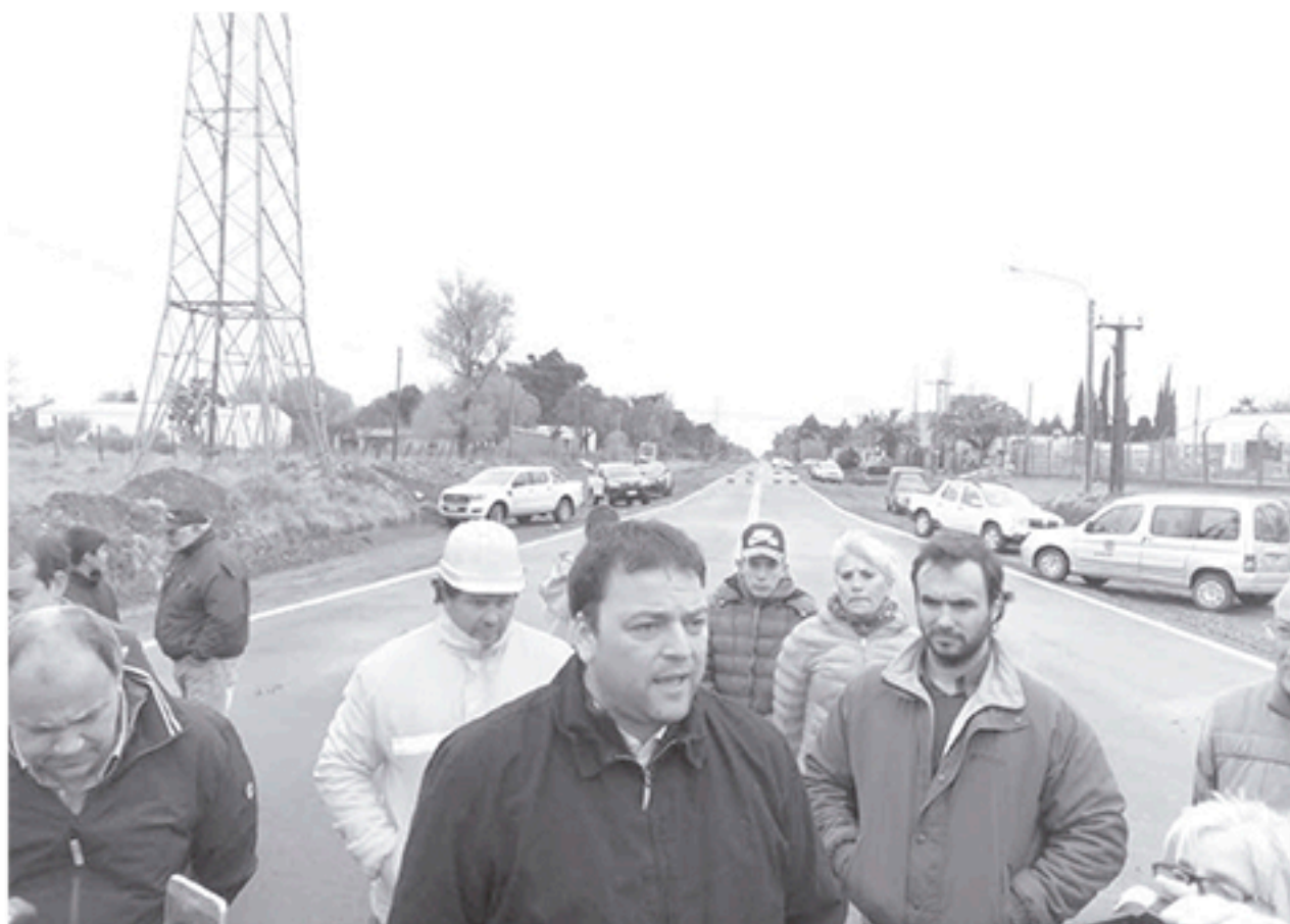
El Intendente se dirige a los presentes, de fondo el acceso de la Av. Urquiza.

CON UN GRAN FIN DE SEMANA PARA TODA LA FAMILIA