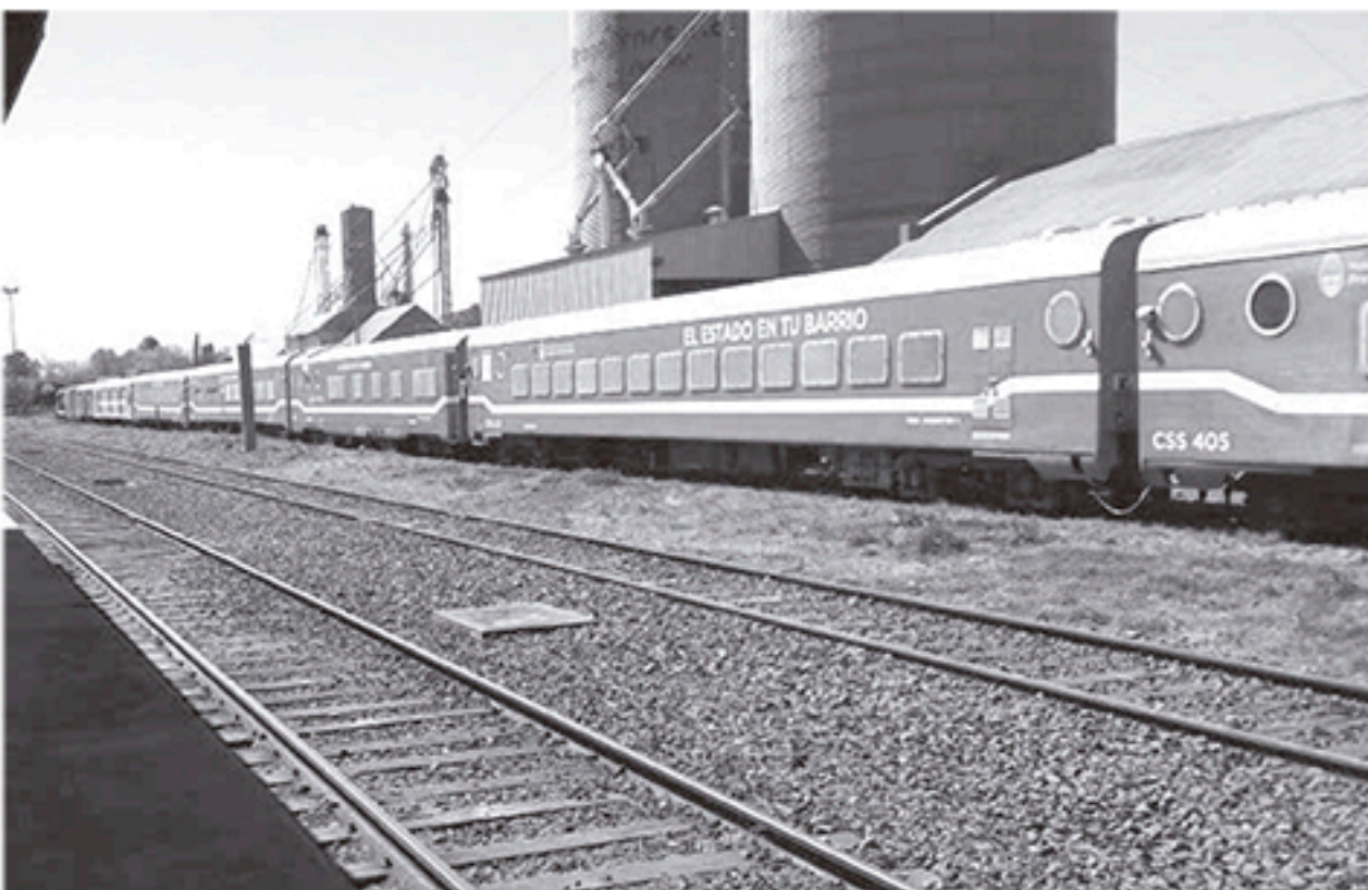
Ya se encuentra en nuestra ciudad el Tren Sanitario que comenzará su atención a partir del próximo lunes.

HOY, EN LAS INSTALACIONES DEL CLUB ATLÉTICO SAN MARTIN