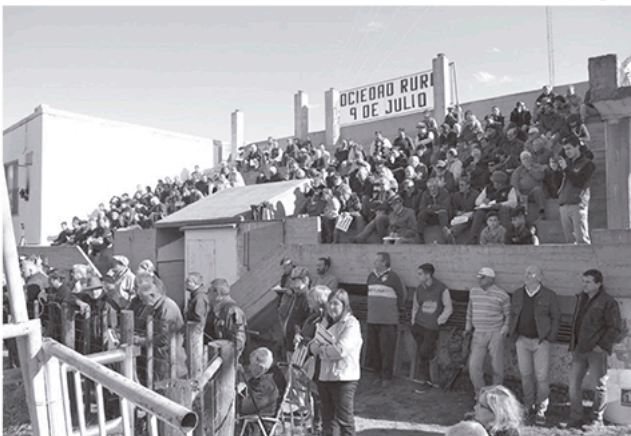
Importante asistencia de productores presentes en el remate en Sociedad Rural.