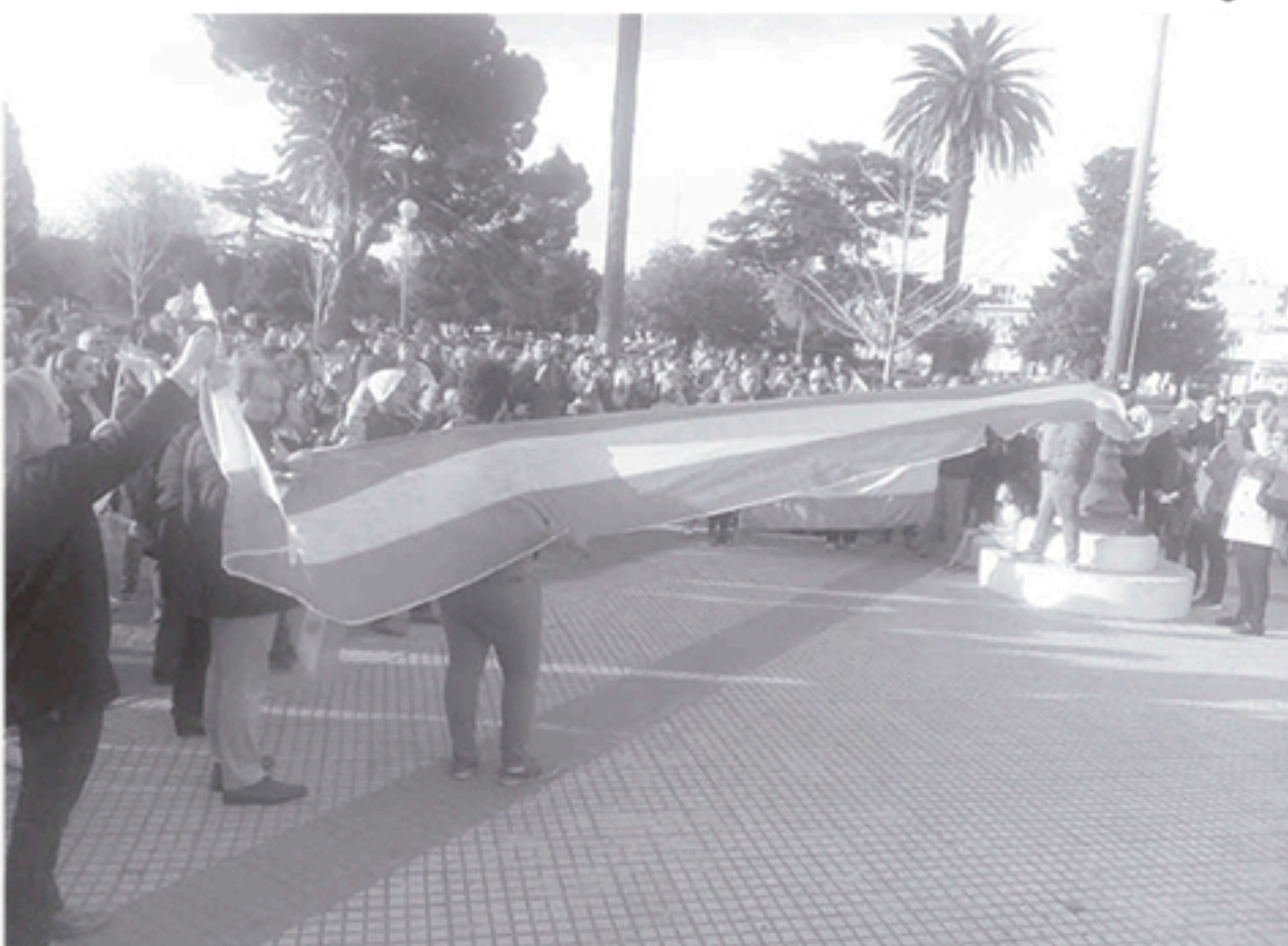
Partidarios, adherentes y vecinos que se sumaron a la marcha proclamada en favor del gobierno.