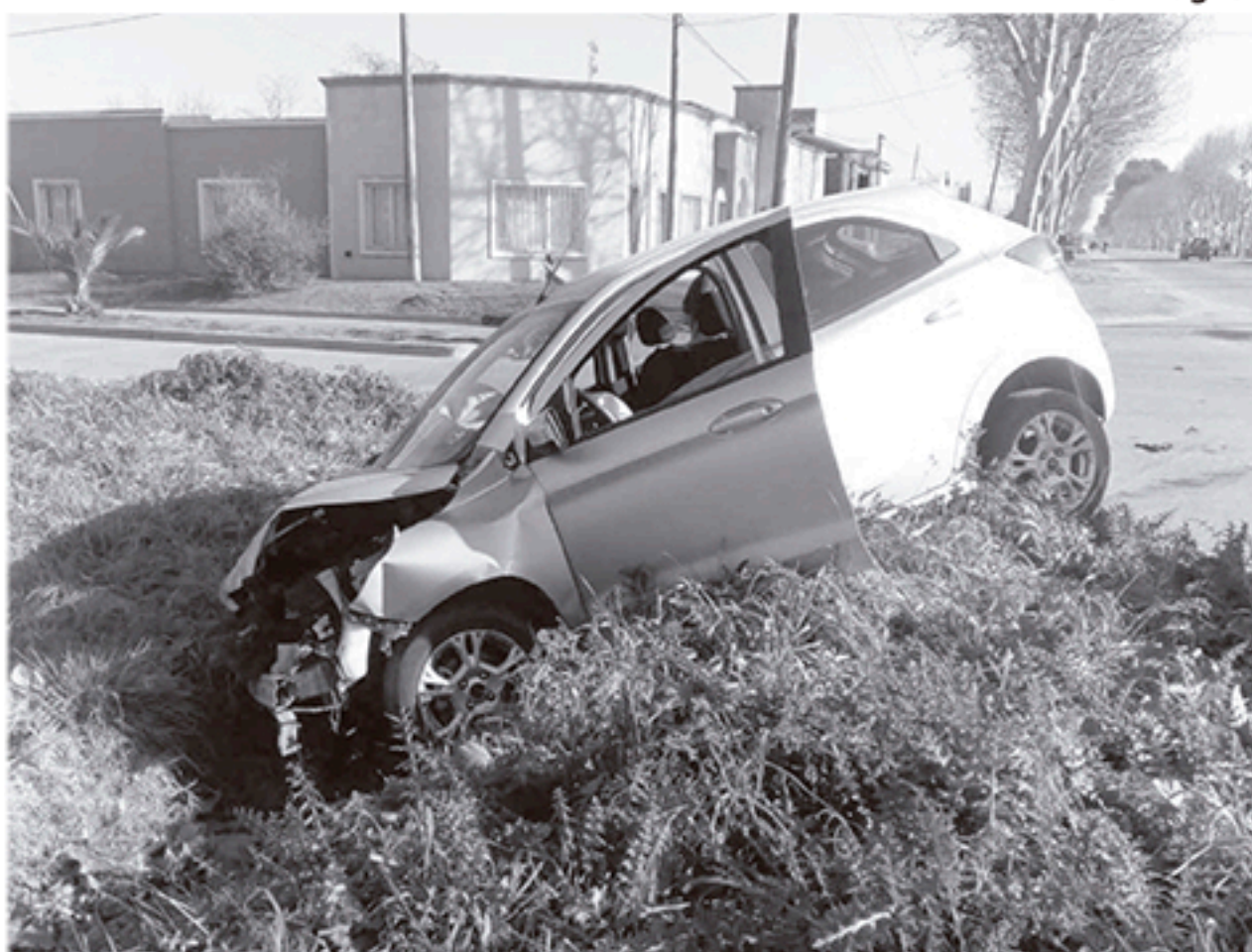
Estado en quedó el Ford Ka después del violento impacto contra la camioneta.

LA GRAN FINAL SE DISPUTA ESTE DOMINGO, A LAS 15,30 HS.